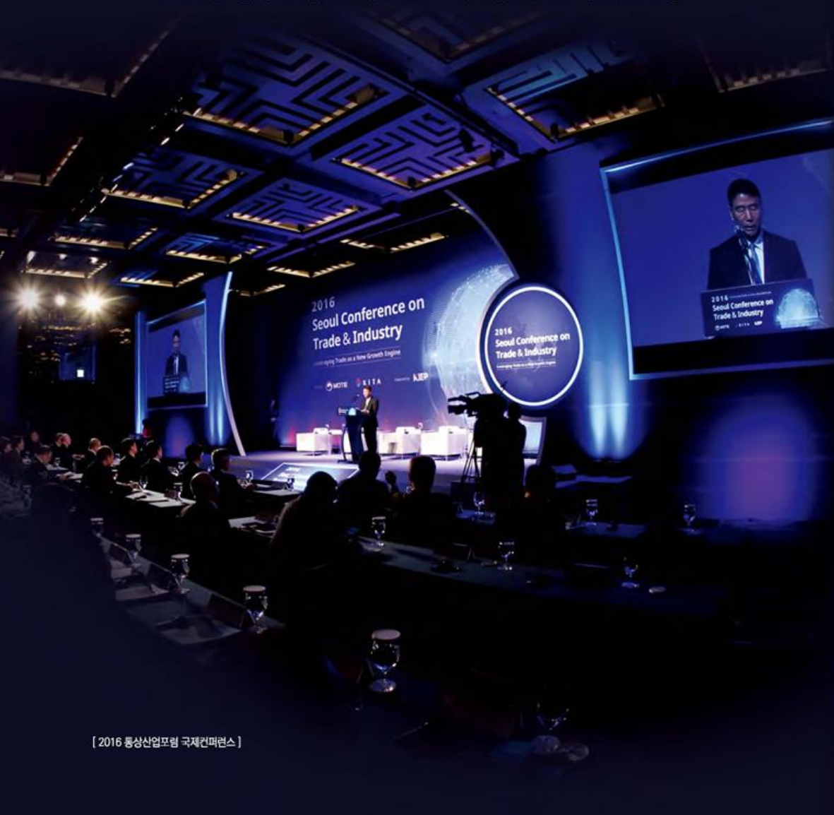
[ 2016 통상산업포럼 국제컨퍼런스 ]

Conference, Congress, Forum, Symposium, Lecture, Seminar, Clinic, Panel Discussion, Teleconferencing