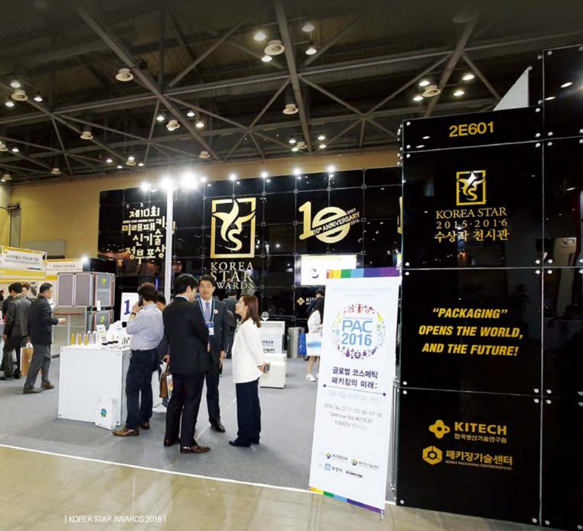
[ KOREA STAR AWARDS 2016 ]

+ Exhibition Portfolio Expo, Fair, Gallery, Pavilion