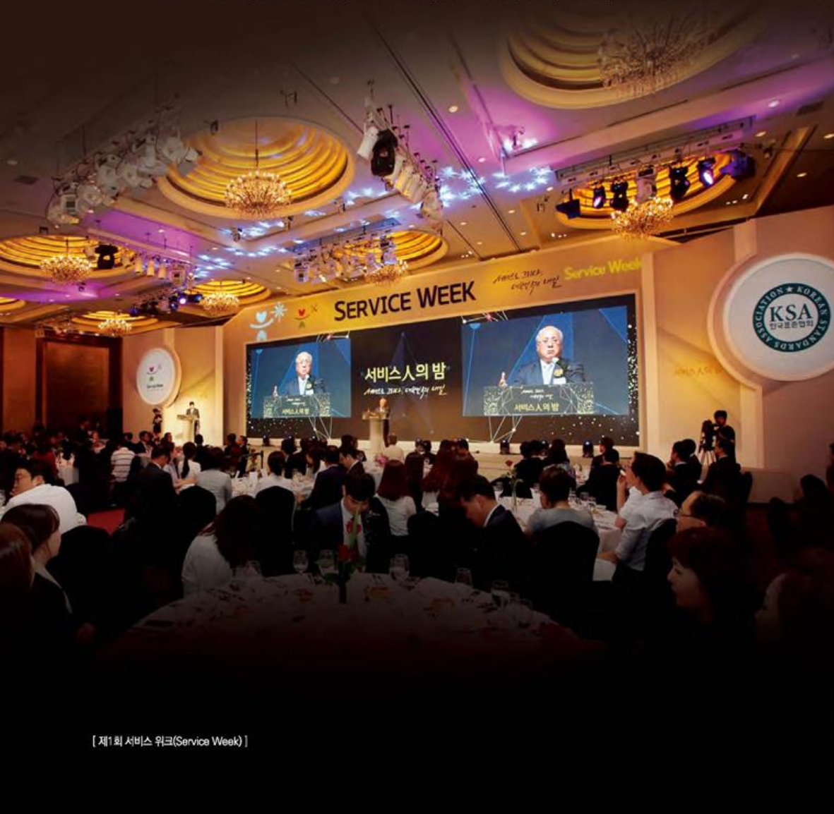
[ 제1회 서비스 워크(Service Week) ]

Event Promotion, Sales Promotion, Inner Promotion, Public Promotion, CRM, Marketing Promotion