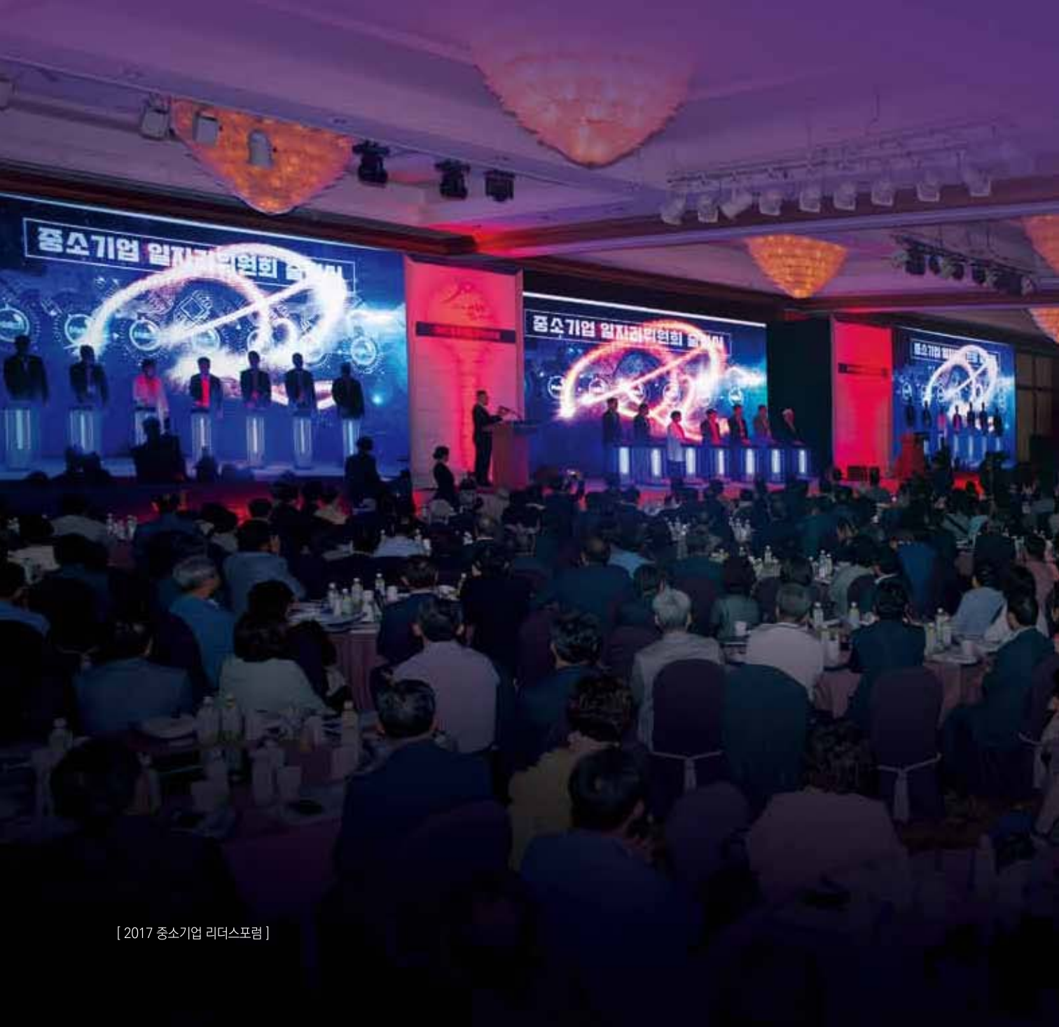
[ 2017 중소기업 리더스포럼 ]

Event Promotion, Sales Promotion, Inner Promotion, Public Promotion, CRM, Marketing Promotion