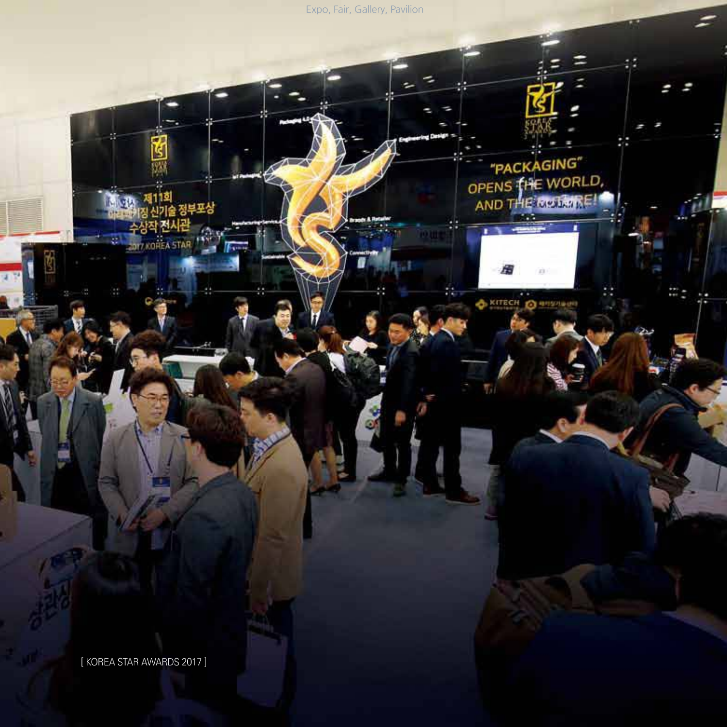
[ KOREA STAR AWARDS 2017 ]

+ Exhibition Portfolio Expo, Fair, Gallery, Pavilion