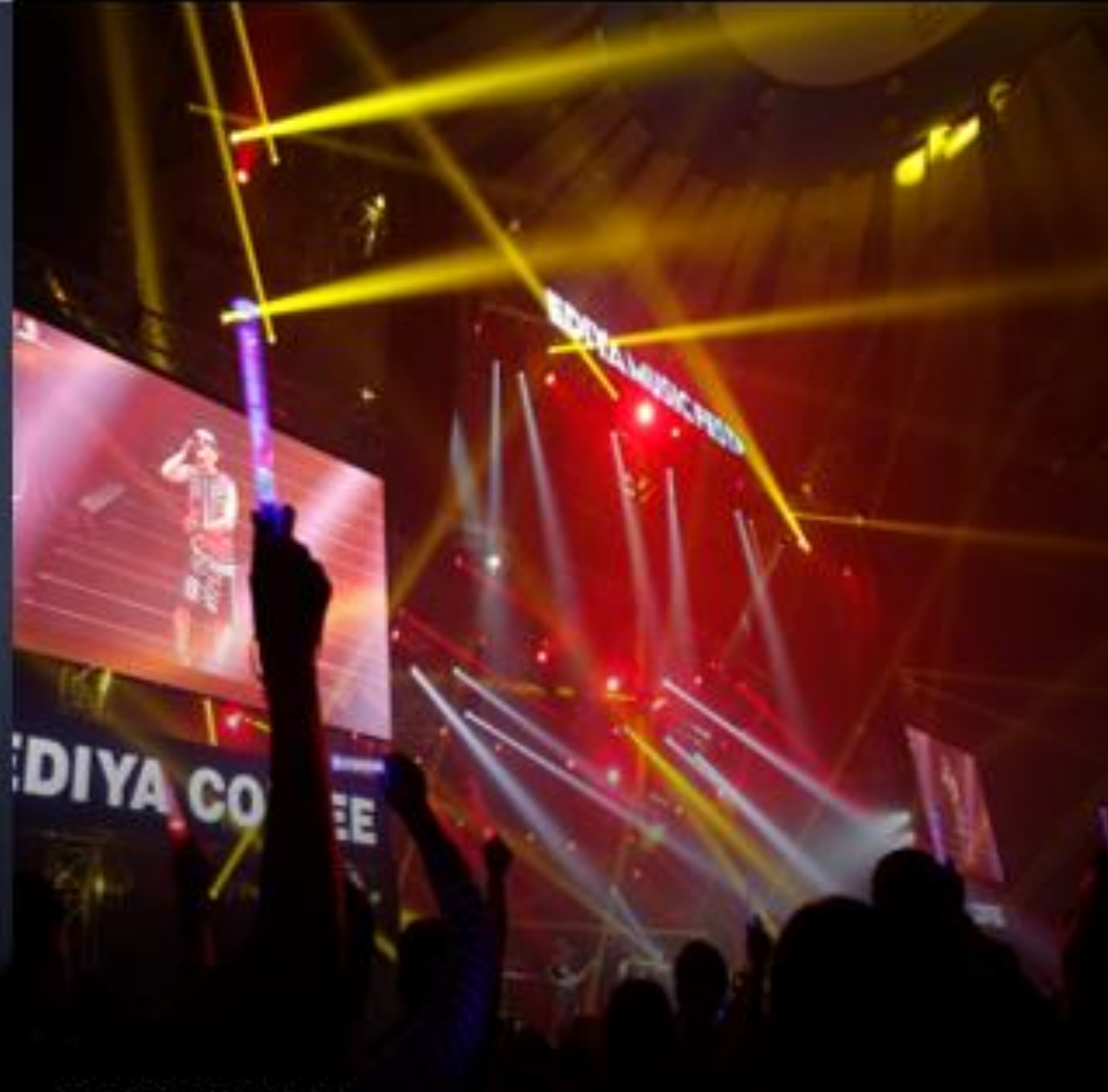
EDIYA COFFEE EDIYA MUSIC FESTA