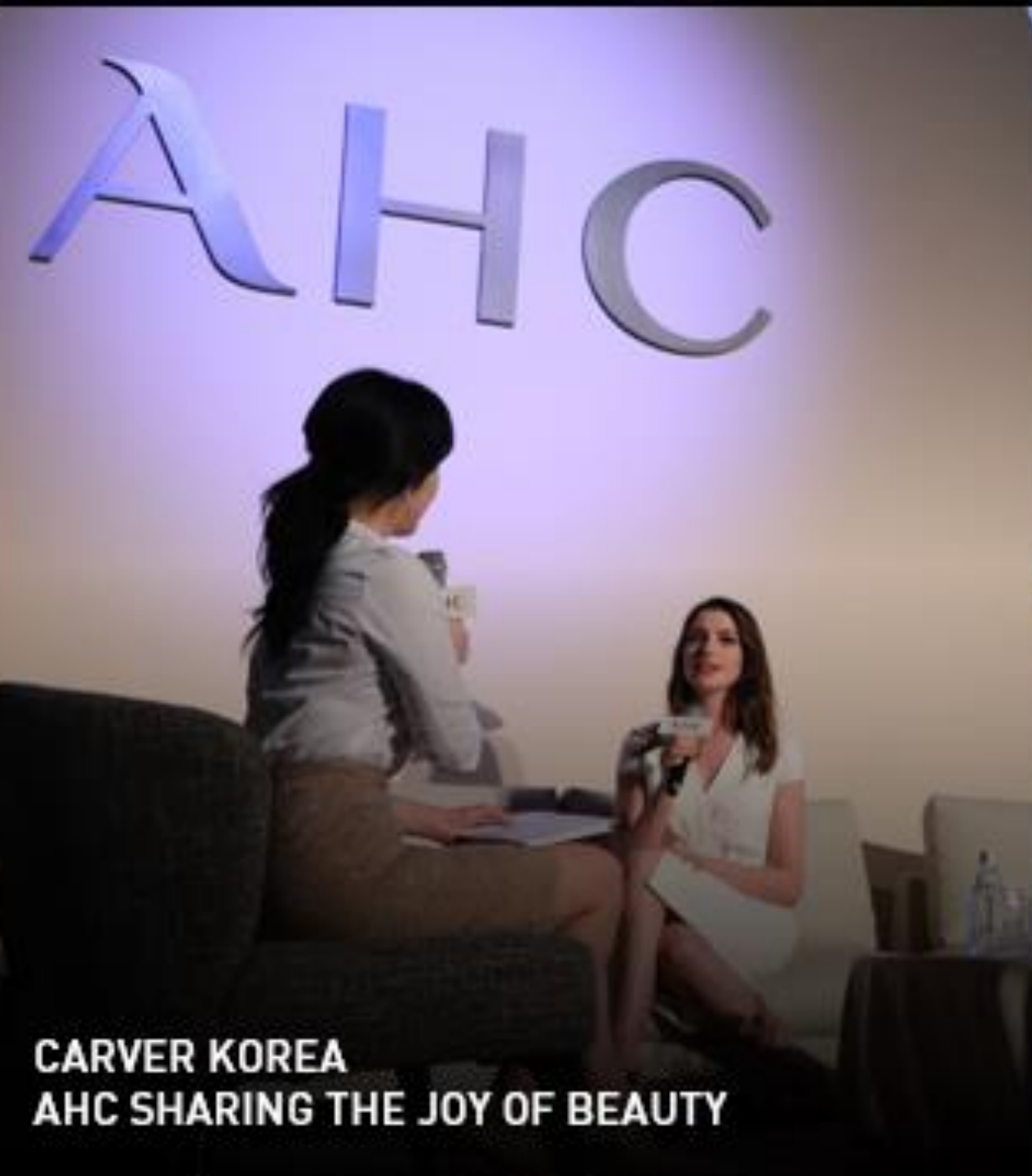
CARVER KOREA AHC SHARING THE JOY OF BEAUTY

고객사의 가치를 재발견하고, 감각적인 크리에이티브로 소비자의 마음을 사로잡는 이벤트를 디자인하고 실행합니다.