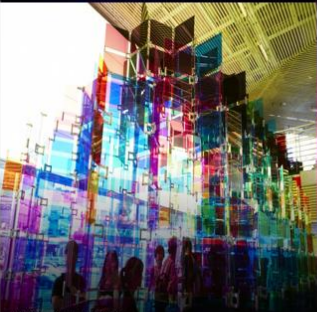
HYUNDAI MOTORS COLORED SPACE, COLORED LANDSCAPE

가치있는 경험과 특별한 만남을 통해 예술적 미래가치를 실현하고, 매력적인 콘텐츠를 제작합니다.