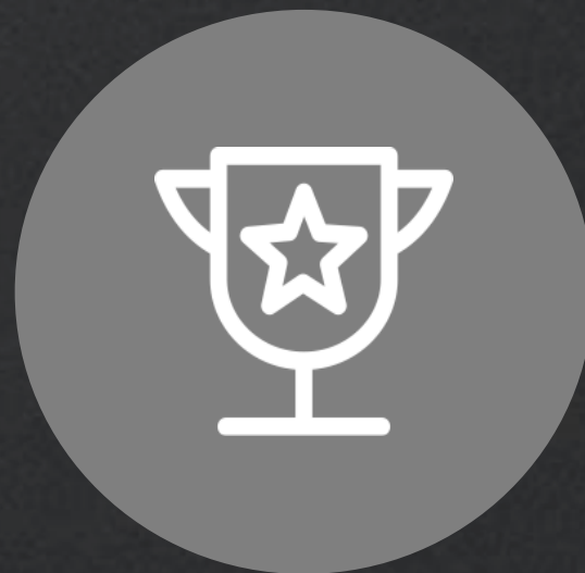
Break The Rules