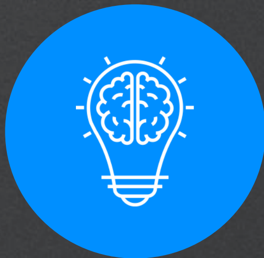
Spotlight of Truth

VIP 행사, 메가 이벤트, 홍보 행사, 런칭 파티, 연간 캠페인까지 다양한 분야에 걸친 총 1,570번의 이벤트를 성공적으로 수행하였습니다.