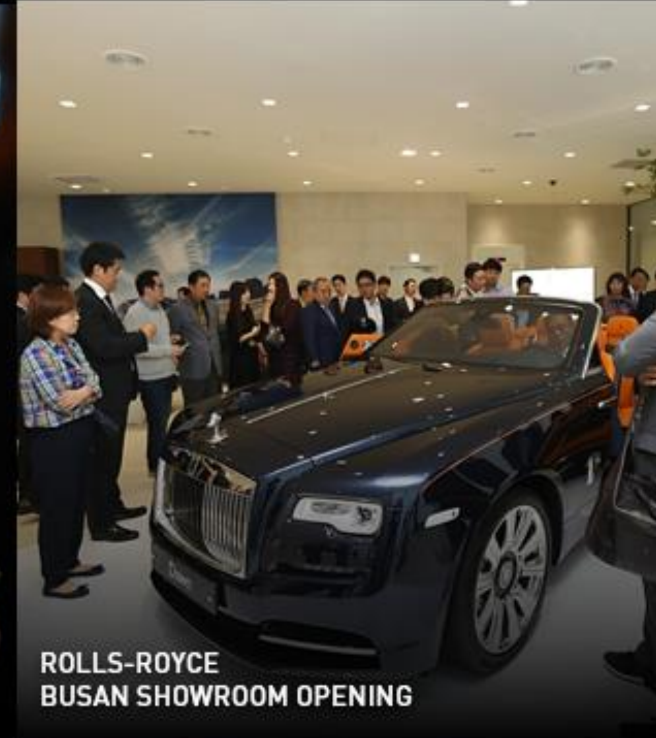
ROLLS-ROYCE BUSAN SHOWROOM OPENING