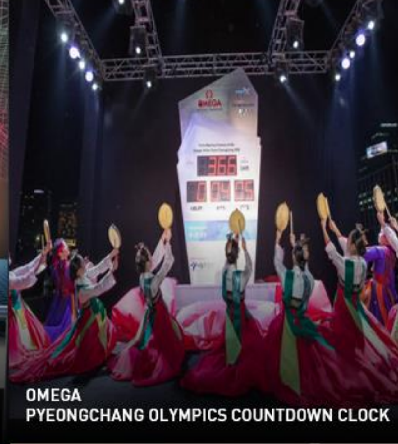
OMEGA PYEONGCHANG OLYMPICS COUNTDOWN CLOCK