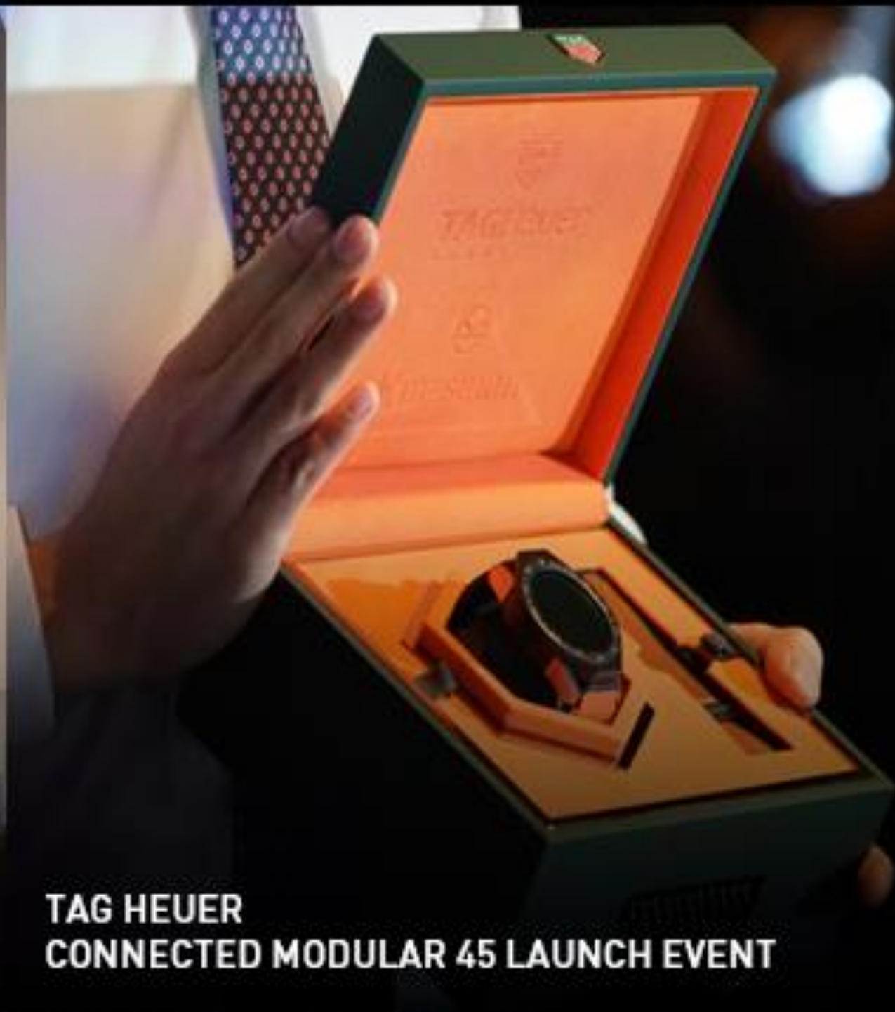
TAG HEUER CONNECTED MODULAR 45 LAUNCH EVENT