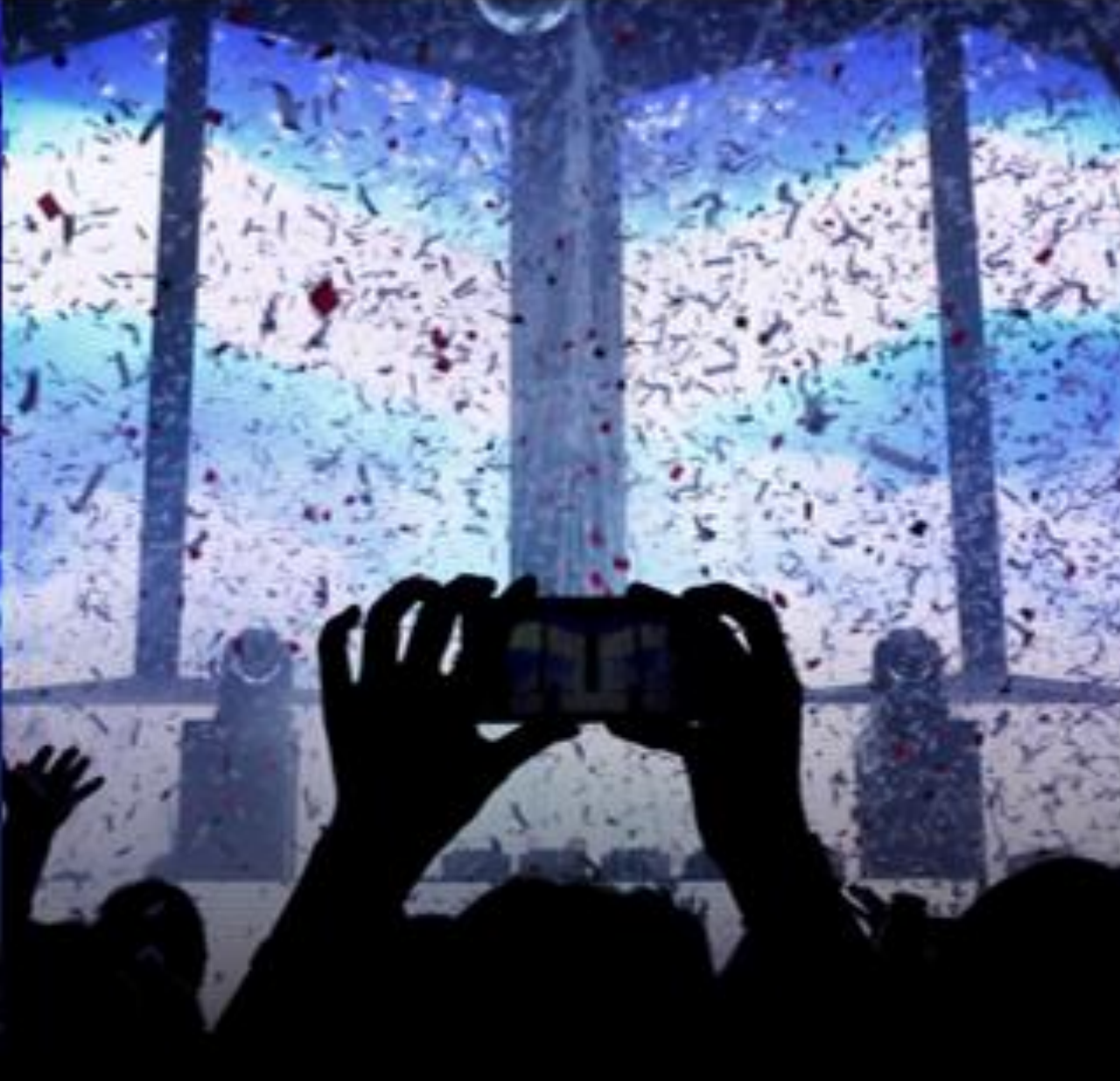
EDM MUSIC PARTY HEAVEN & HELL