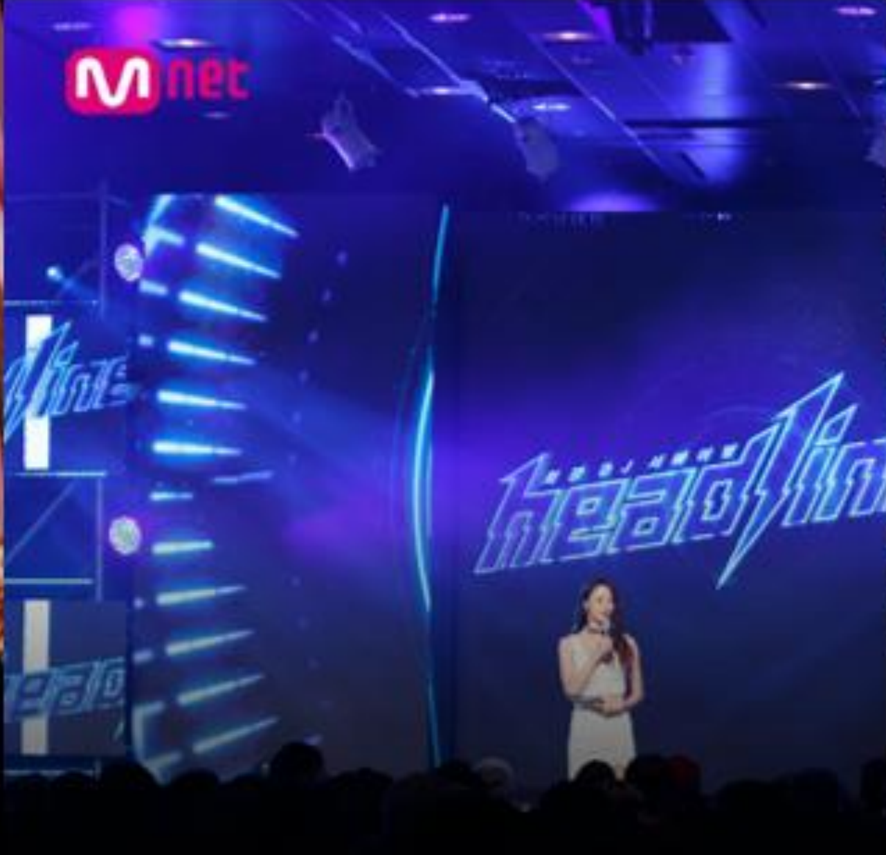
MNET X MOTZ CO-PRODUCE DJ SURVIVAL TV PROGRAM "HEADLINER"