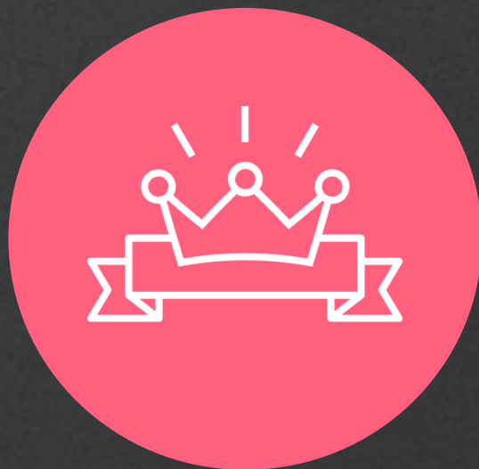
Celebrate Your Life