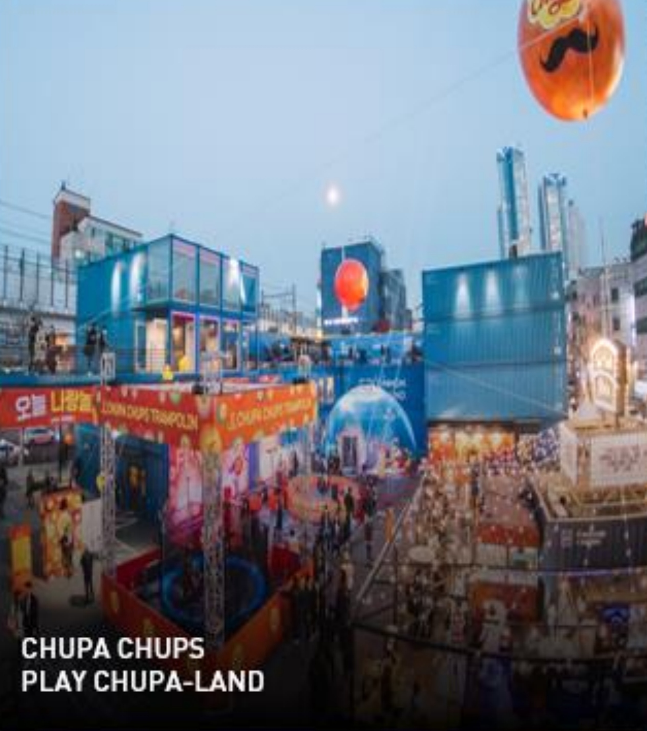
CHUPA CHUPS PLAY CHUPA-LAND