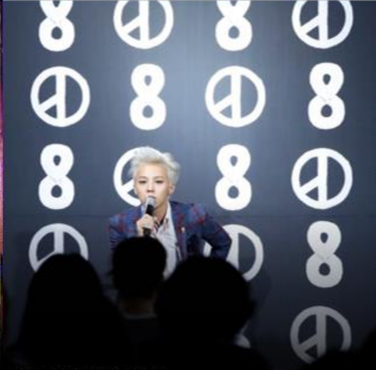
YG ENTERTAINMENT G-DRAGON SPACE 8