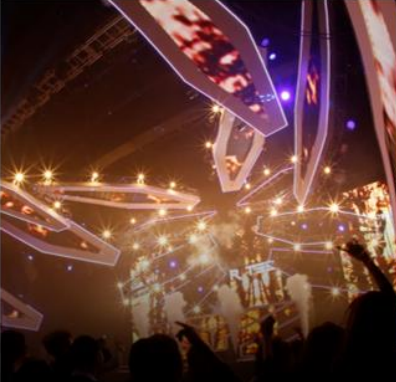
ELECTRO POP MUSIC FESTIVAL HEADLINER FESTIVAL