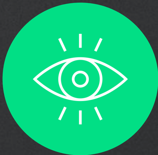
Shock Your Senses