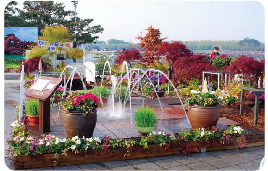
2013년 고양 꽃 박람회 설치