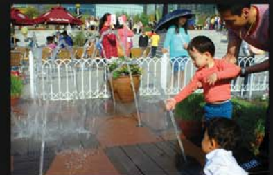
어린이 놀이시설로 활용