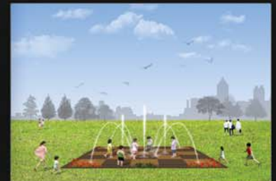
각종 행사장에 수공간 연출

설계, 시공에 소요되는 긴 시간과 어려움, 고가의 설치비, 사후 유지관리 및 비가동시 흉물이 되었던 분수대 문제 해결. 렌탈비용만으로 장소, 기간 제약 없이 분수대를 설치, 이용 가능.