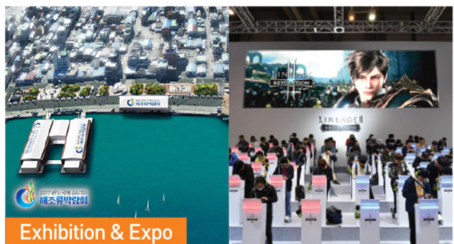
Exhibition & Expo