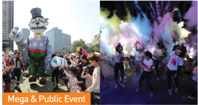
Mega & Public Event