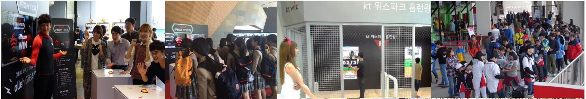
KT WIZ 야구배팅게임 스마트홈런왕