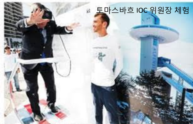
토마스바흐 IOC 위원장 체험

리우 KT 부스에서 VR 스키점프 체험하는 IOC 위원장. KT는 2016 브라질 리우데자네이루 하계올림픽 기간 동안 코파카바나 해변에서 열리는 '평창홍보관'에서 9월 (현지시간) '평창의 날' 행사를 진행한다고 밝혔다. '평창의 날' 행사에 참여한 토마스 바흐 IOC 위원장은 12월이 KT 부스에서 가상현실(VR) 스키점프를 체험하고 있다.