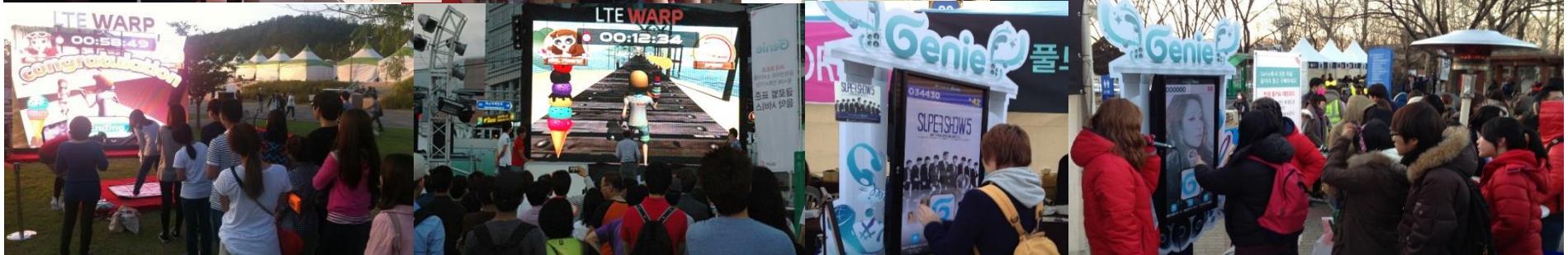
KT LTE WARP 런닝맨