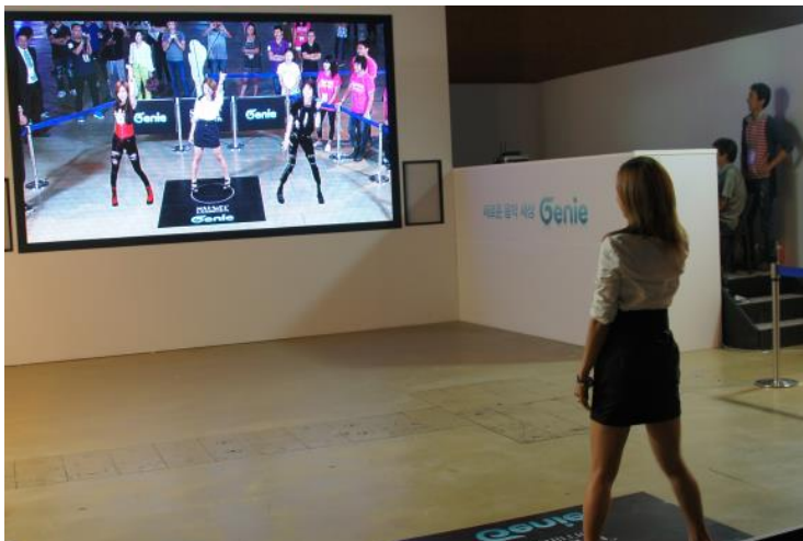
MWC(Mobile World Congress) 바르셀로나