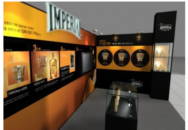
(위) 2005 HP관 운영 (가운데) 2006 대한민국 주류 박람회 (아래) 2009 위조상품 비교 전시회