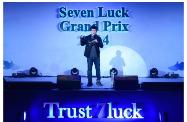
2014 세븐럭 카지노 연간대행 디너쇼, 신춘교류회, 셀럽파티 등