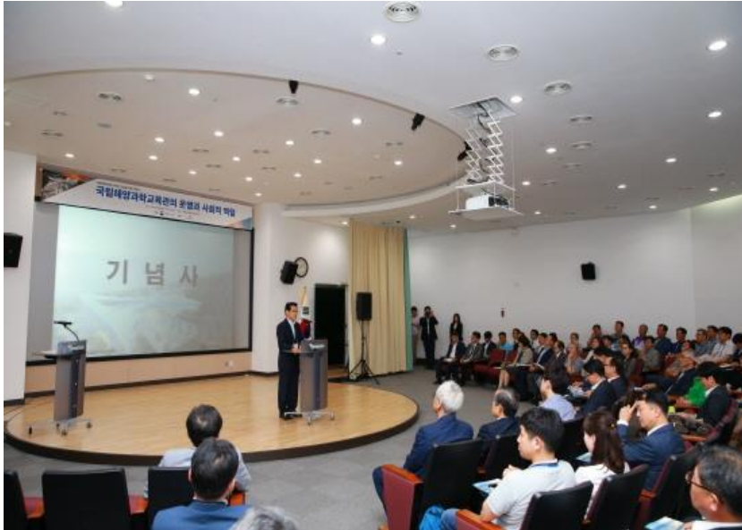
(위) 2016 서울 애니메이션센터 5월 가정의달 축제 (아래) 국립해양과학교육관 건립을 위한 세미나