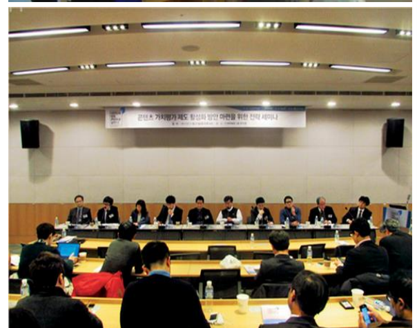
(위) 광주 ACE Fair(GITCT) (가운데) 서울 캐릭터라이선싱 페어(GITCT) (아래) 가치평가세미나