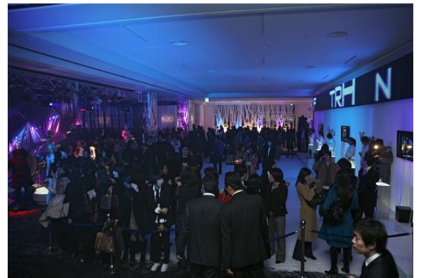
(위) 2014 미쉐린 코리아 Multi-z 신제품 발표회 (아래) 2015 브라운 면도기 신제품 <Series 9> 런칭