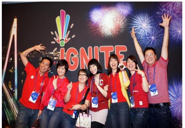
(위) 2013 현대자동차 글로벌 인플루언서 프로그램 (아래) 2015 미쉐린타이어 딜러 초청 컨퍼런스